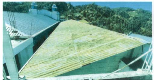
Foto 4: Lámina de techado, lado izquierdo E.O.R.M Aldea Cabajchun